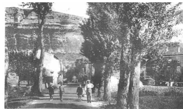
7662, St-DIDIER-sous-AUBENAS — Route Nationale 102

L'Etat via la Direction Interdépartementale des Routes (DIR) projette de regoudronner la partie la plus abîmée de la RN 102 de St Didier en 2016 pour tenir compte des travaux à venir de mise en conformité du tunnel de Baza et des travaux préalables de la traversée de St Didier incombant à la commune.